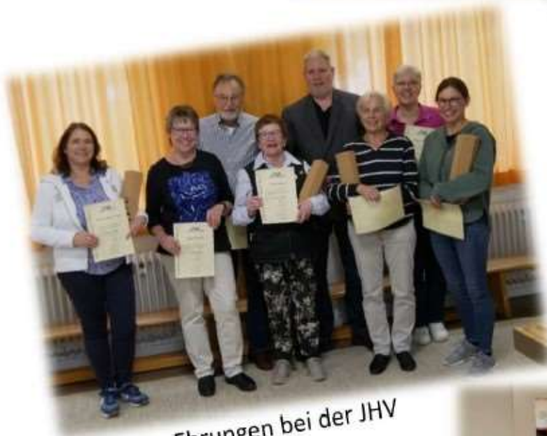
Ehrungen bei der JHV